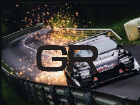
Za mały kontrast.