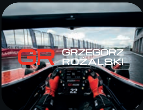
Za mały kontrast, zbyt dużo szczegółów.

Szczególną uwagę należy zwrócić na stosowanie logo na tłach ciemnych, kolorowych, teksturowanych oraz fotograficznych. Prawidłowe użycie znaku w takich warunkach pozwala zachować jego rozpoznawalność i profesjonalny wygląd.