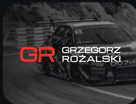
Zastosowanie przyciemnienia obrazu.